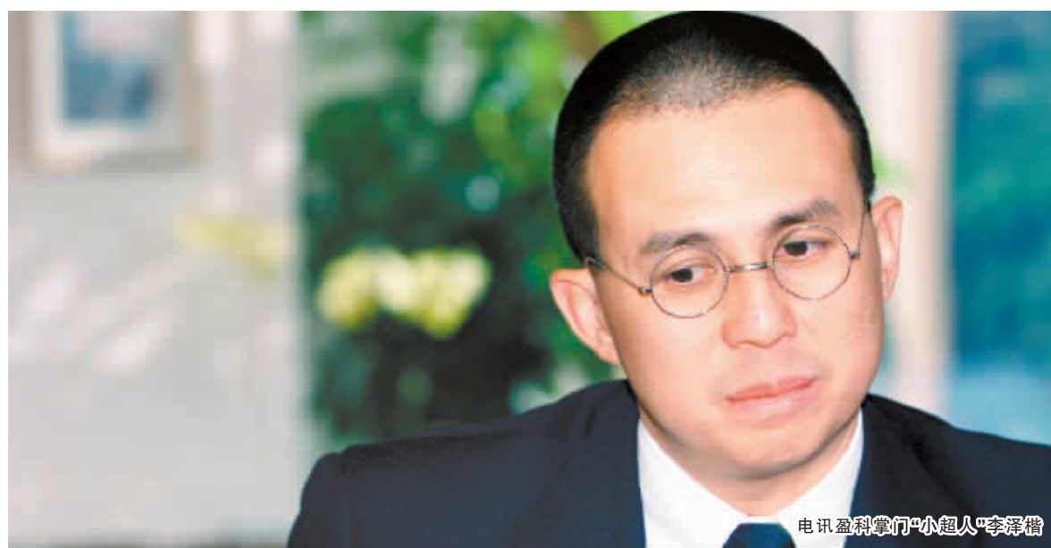
电讯盈科掌门“小超人”李泽楷

月16日上午9:30起暂停交易,昨日上午9:30起恢复买卖。截至昨日收盘,电讯盈科股价跌去13.11%至3.58港元。